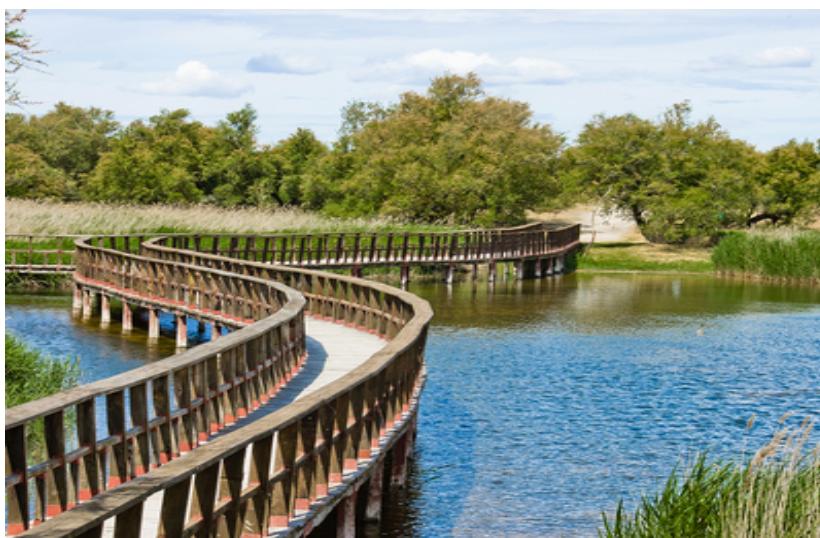
Parque Nacional "Tablas de Daimiel" en peligro de extinción